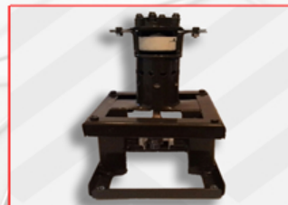
БИНАРНЫЙ ДВИГАТЕЛЬ ВНУТРЕННЕГО СГОРАНИЯ.