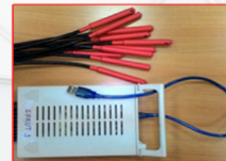
МНОГОКАНАЛЬНАЯ СИСТЕМА РЕГИСТРАЦИИ И ХРАНЕНИЯ ДАННЫХ О ТЕМПЕРАТУРЕ СРЕДЫ.